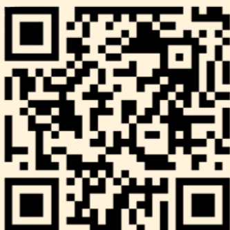
VICKS PROTI NACHLAZENÍ