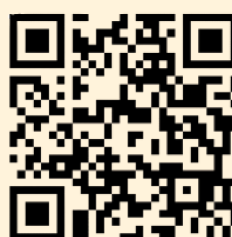
PERSIL NA PRANÍ