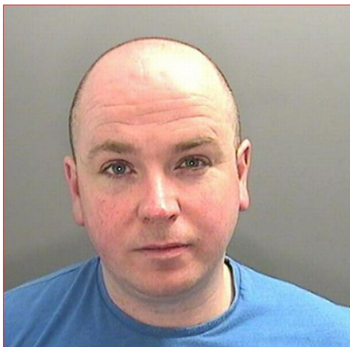
(Pachatel James Stewart Jones)

Zahraniční servery upozorňují také na případy, ve kterých dospělé osoby na Omegle cíleně vyhledávaly nezletilé dívky, které následně nutily k sexuálním aktivitám před webkamerou. Za toto chování byl například odsouzen k trestu odnětí svobody ve výši 6 let James Stewart Jones z Velké Británie (Owen, 2017) – ten se na Omegle zaměřoval na děti ve věku 11-15 let, které nutil k sexuálním videochatům, ze kterých si pořizoval záznamy a sám se při nich uspokojoval.